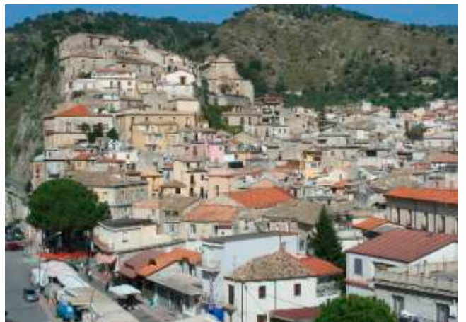
Gioiosa Jonica, un Borgo incastonato sulla rupe a modo di presepe con antiche case e palazzi nobiliari di rilevante importanza artistico-culturale.