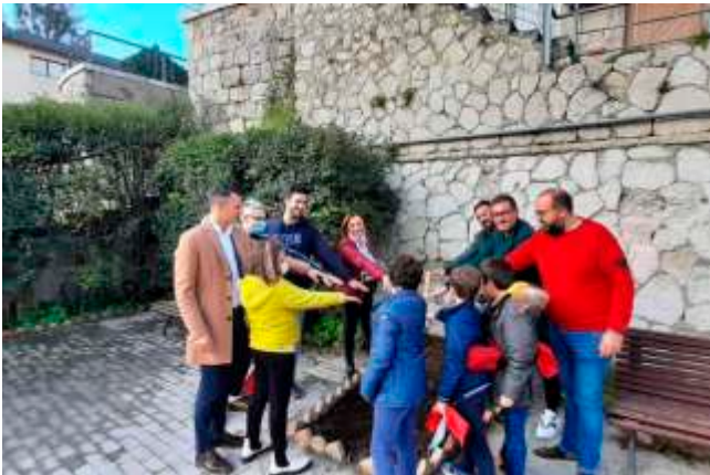
Giornata Nazionale dell'albero 2021