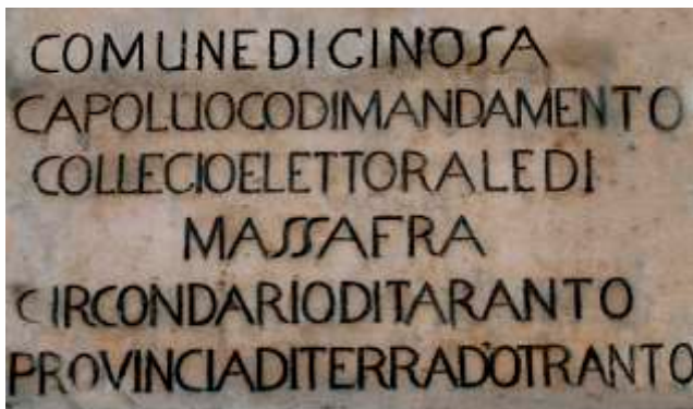
Targa in pietra calcarea locale, opera d'arte con valenza storica ed urbanistica, testimonia l'appartenenza di Ginosà, fin dall'XI secolo, alla provincia di Otranto, comprendente i territori Lecce, Taranto, Brindisi e fin al 1663 il territorio di Matera.