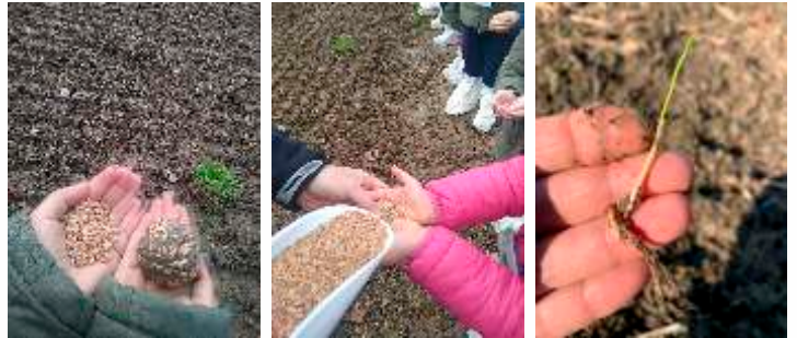
Club per l'UNESCO di Ferrara per la valorizzazione del progetto "Adotta un campo di grano dei Molini Pivetti" Mese ottobre semina/novembre germoglio.